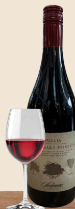
NEGRO AMERO PRIMITIVO

Tempranillo | rijp rood fruit | cederhout | vanille | specerijen | 14%