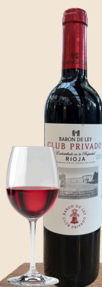
BARON DE LEY CLUB PRIVADO

Côtes de cascogne | sauvignon blanc | colombard | citrus | wit fruit | ananas | 11,5%