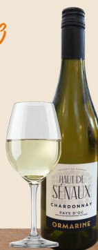
HAUT DE SENAUX CHARDONNAY

Friuli Venezia Giulia | fris | citrus | peer | appel | 13%