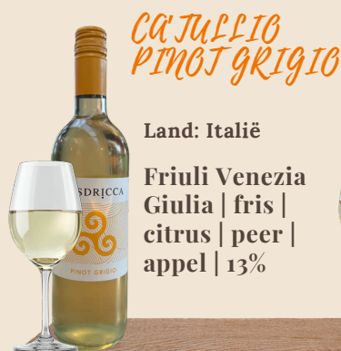
CAJULLIO PINOT GRIGIO