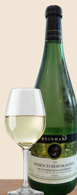
REINHART BEREICH BERNKASTEL